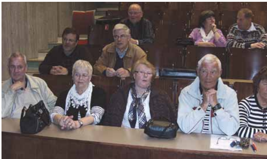
Et utsnitt av engasjerte tilhørere.

Onsdag 28. april hadde A.L.Fs lokallag i Aust-Agder og Vest-Agder avtalt felles møte i Frivillighetens hus i Kristiansand. Tema for kvelden var: ”Gamle og nye regler omkring folketrygdens pensjonsordninger” og ”Fremtidige felles arrangementer A.L.F Aust-Agder og A.L.F Vest-Agder.