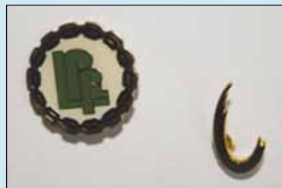
LFFL-merket, her sammen med NHF-nål

A.L.F Hovedstyre har innhentet tilbud på pins. Dere husker vel merket vi hadde og bar med stolthet da vi het (LFFL) Landsforeningen for løsemiddelskadde.