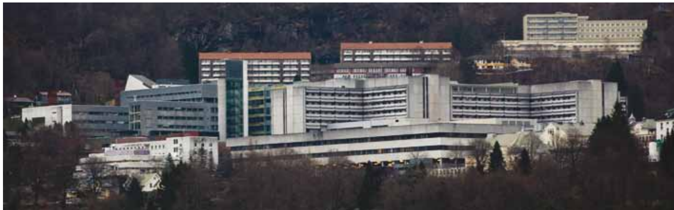
Haukeland Universitetssykehus

på hvorfor så mange tidligere offshoreansatte har blitt uføre, syke og døde av det.