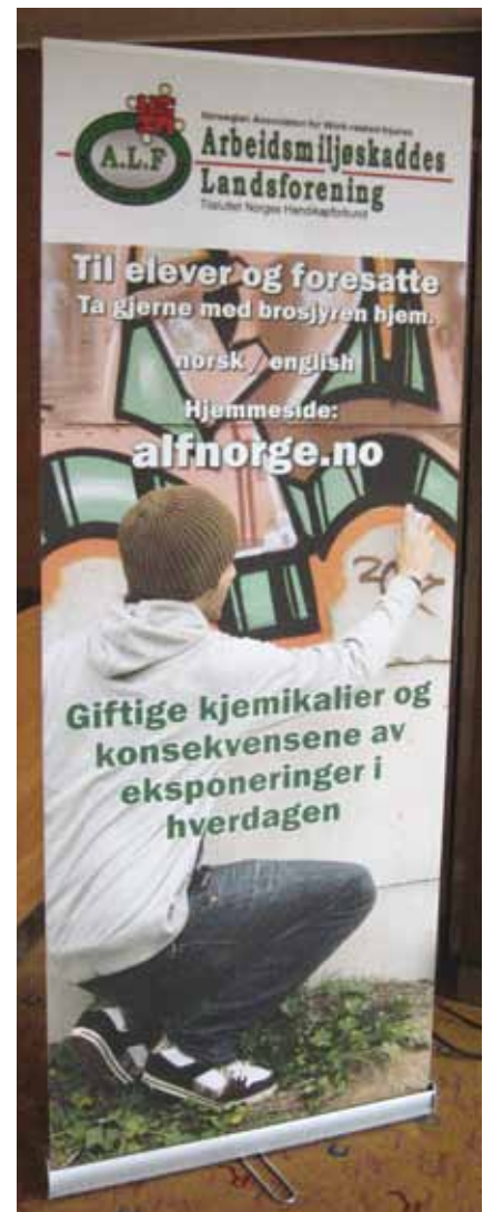
Roll-up med bilde av forsiden på brosjyren som skal deles ut til avgangselevne i Osloskolen.