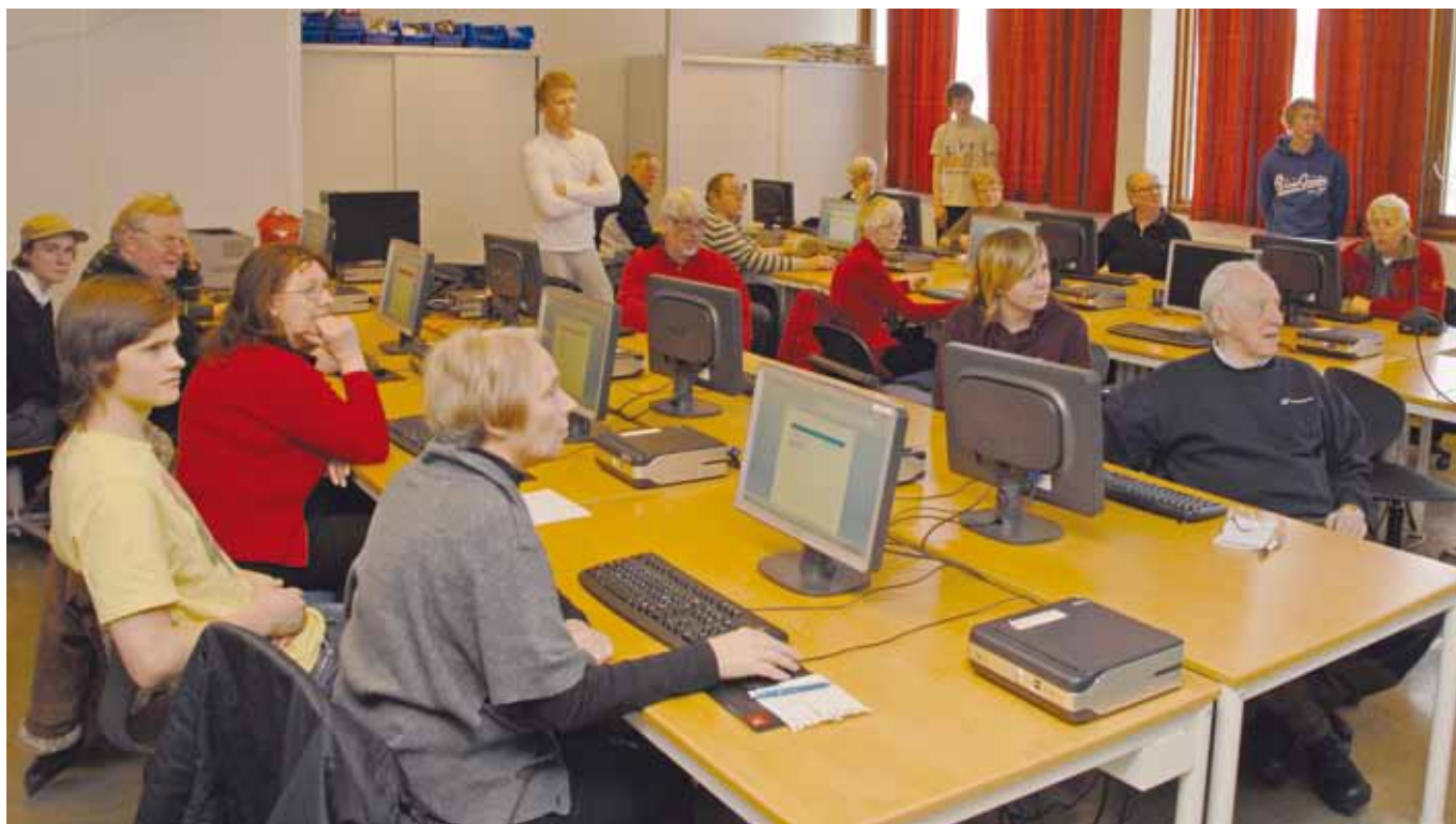
Konsentrerte deltagere følger instruksene på storskjerm, før de prøver seg på egen maskin.